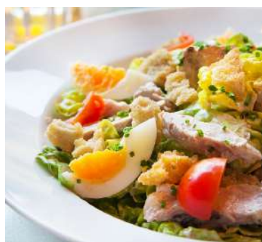
De Pasta Kantine